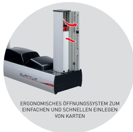
ERGONOMISCHES ÖFFNUNGSSYSTEM ZUM EINFACHEN UND SCHNELLEN EINLEGEN VON KARTEN